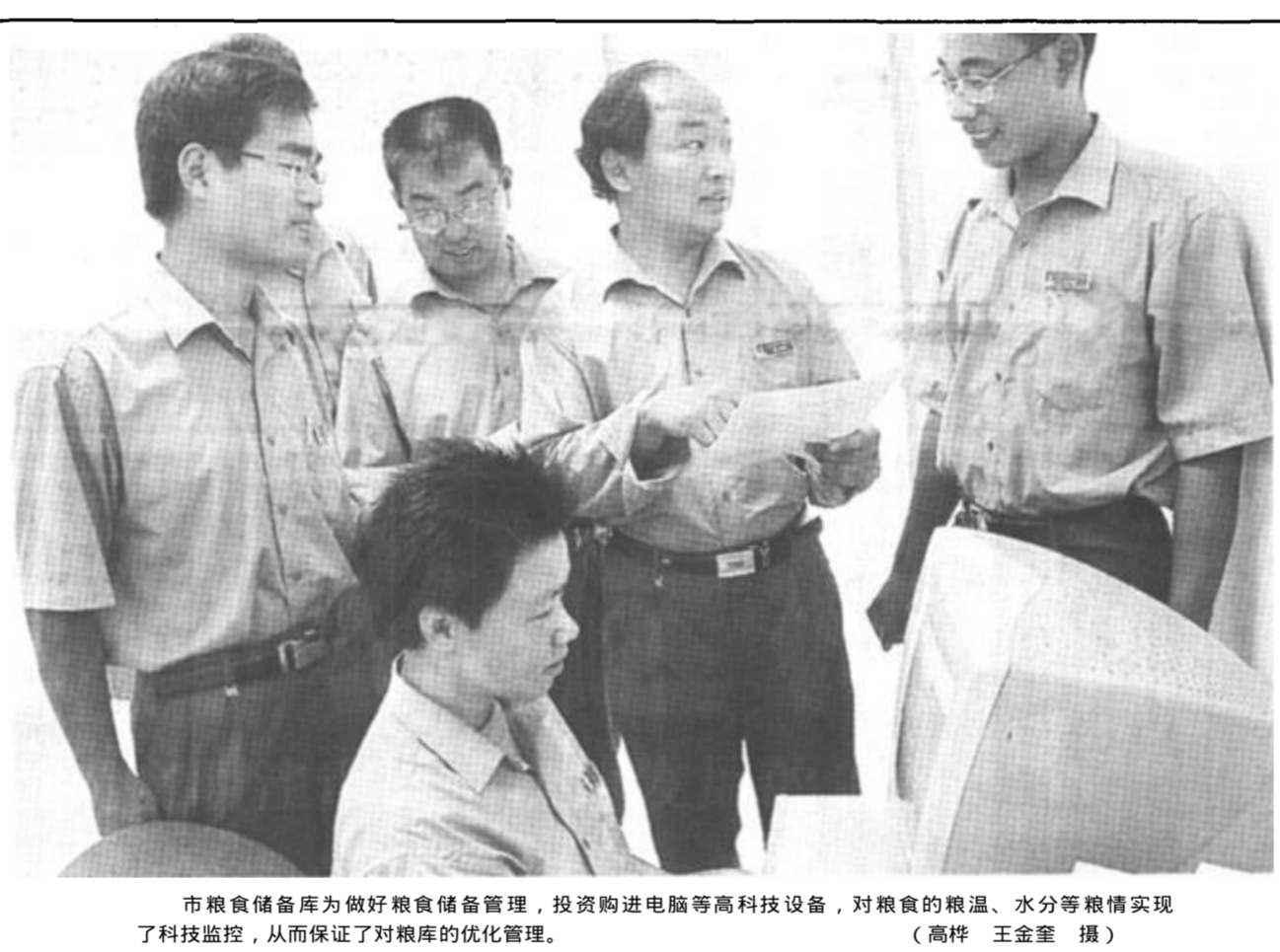
市粮食储备库为做好粮食储备管理，投资购进电脑等高科技设备，对粮食的粮温、水分等粮情实现了科技监控，从而保证了对粮库的优化管理。

高效率的服务手段，营造了良好的投资环境，这使温州、滨州、淄博等省内外投资商纷至沓来，通过一年的推动，先后由温州、寿光等地客商投资2000万元盘活油地闲置资产，启动三个油地废弃育苗场，繁育蟹、虾、蛭虫等水产品种。截至目前，已有12个地区的外商前来建成水产养殖场200个，实际利用外资达8000万元。(苏志毅 李冬梅 赵梅)