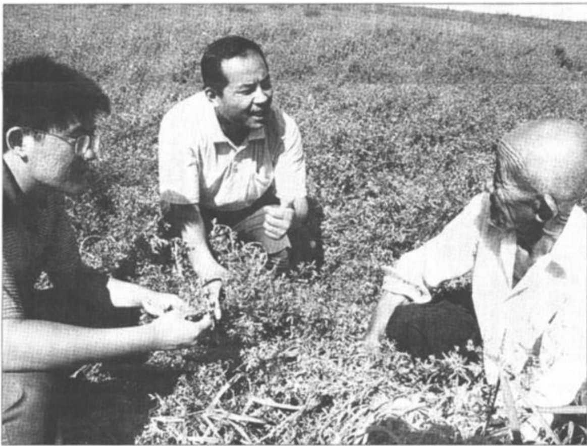
明集乡以市场需求为导向，大力发展牧草种植业，建成了五千亩饲草基地。今年，他们引进了中百号、美国皇后、弗纳尔等优质品种，预计亩产干草可达一千公斤，总产值达一百八十元。