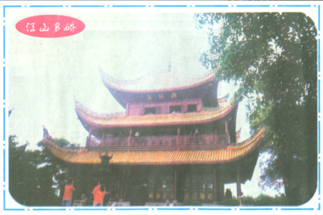
江南名楼——岳阳楼

丹麦国菜:魔鬼太阳 丹麦气候寒冷,大地是个天然的冷冻箱,肉类无腐败之虞,可以拿来生吃。丹麦最有名的国菜就是用生牛肉制成泥状,上面放一个生蛋黄,与肉搅匀了用汤匙挖下来一口一口吃掉,这道菜叫“魔鬼太阳”。(阿麦)